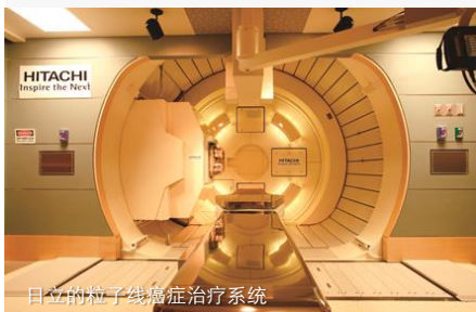
日立的粒子线癌症治疗系统

今后,日立将进一步强化临床诊断、检查·药物样品、信息科学这三大核心领域,同时与信息通信系统公司等社内公司携手,提供与以上核心领域相结合的解决方案及服务。通过对Care Cycle(完整关怀周期)·创新、医疗创新的投入,加速推进医疗健康事业的发展战略,举日立集团之力凭借医疗健康创新实现医疗品质和效率的提升。