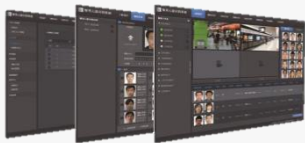
“智寻”高速人脸检索与识别系统的操作界面（上）及应用领域（右）

日立北工大计划在2016年底将日立智寻提供给上百家客户。总经理松崎胜彦表示，该系统的广泛应用，必将促进整个安防产业的进步。