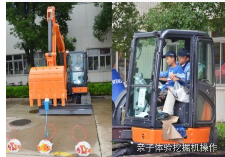
亲子体验挖掘机操作

2015年6月28日，由日立建机（中国）有限公司举办的第二届日立建机工厂开放日活动拉开帷幕，百余名员工家属齐聚合肥工厂，共同度过了一个愉快而难忘的周末。通过别开生面的活动和互动，家属们不仅能够亲身感受日立建机工厂优越的工作氛围，更能了解产品知识，并深入理解日立的企业文化。此次工厂开放日活动吸引了日立建机在中国各家企业的员工及员工家属共计200余人参加，活动现场气氛欢乐而热烈。