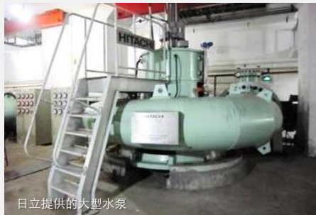
日立提供的大型水泵

河水多含泥沙的特点，借助以CFD为基础的抗磨技术对泵内结构进行适宜的涂层处理，以降低叶片等内部结构的磨损，延长产品使用寿命。迄今，日立已向中国市场提供了54台水泵产品，产品应用在以南水北调为代表的水利项目之中。