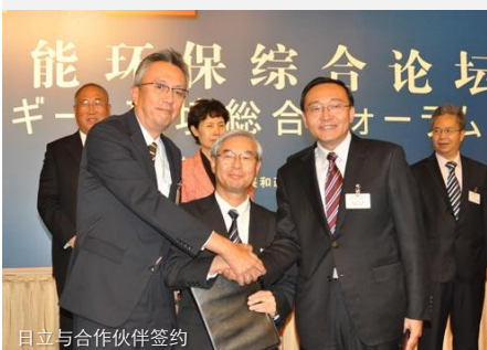
日立与合作伙伴签约

根据协议，江森自控将会获得日立空调·家用电器株式会社旗下销售额超过3,000亿日元(约26亿美金)的全球空调业务的60%所有权(不包括日本地区的销售和运营)。江森自控-日立合资企业将为客户提供全线空调产品，满足全球客户的需要。产品线包括全球领先的变频多联式空调技术，采用尖端直流变频技术的家用空调和吸收式冷水机组。新成立的合资企业将拥有大约13,800名员工和24家制造型工厂，并秉承双方公司在技术和研发方面的优势，不断拓宽市场渠道。此项交易将涉及监管部门的审批，以及是否满足其他惯例条款，预计于今年年底完成。